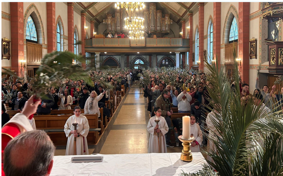
Domingo de Ramos en la Pasión del Señor: pórtico de la Semana Santa. Jueves Santo, Misa de la Cena del Señor: el lavatorio.